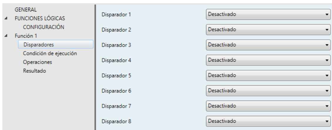
Figura 4. Pestaña "Disparadores"

Desde esta sección se podrá seleccionar hasta ocho disparadores que actuarán como objetos de llamada. Los objetos de llamada serán los responsables de disparar la ejecución de la función cada vez que uno de ellos reciba algún valor desde el bus, siempre y cuando se cumpla la condición de ejecución. Igualmente, si se utiliza un mismo objeto como objeto de llamada de varias funciones, todas ellas se dispararán consecutivamente cuando se escriba algún valor en el objeto.